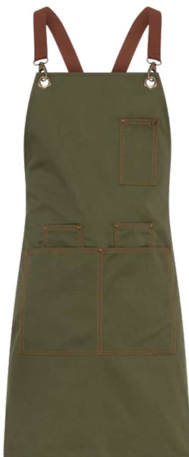
102 Verde militare